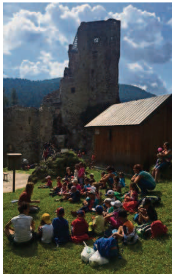
I tosc scota le storie liete davant al ciastel.