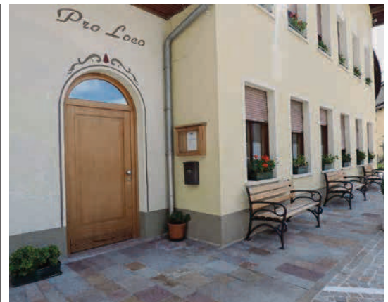
La senta de la Proloco da Col.