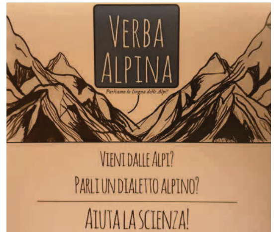
L logo del projet Verba Alpina.